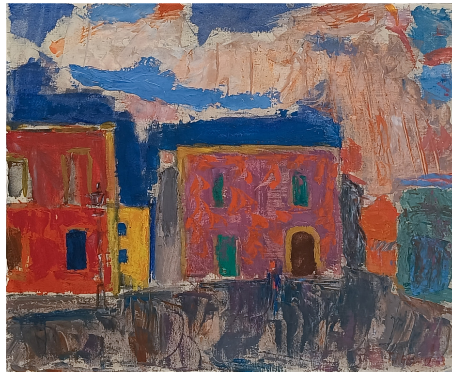
"Røde hus" | olje på plate | 47x42 cm