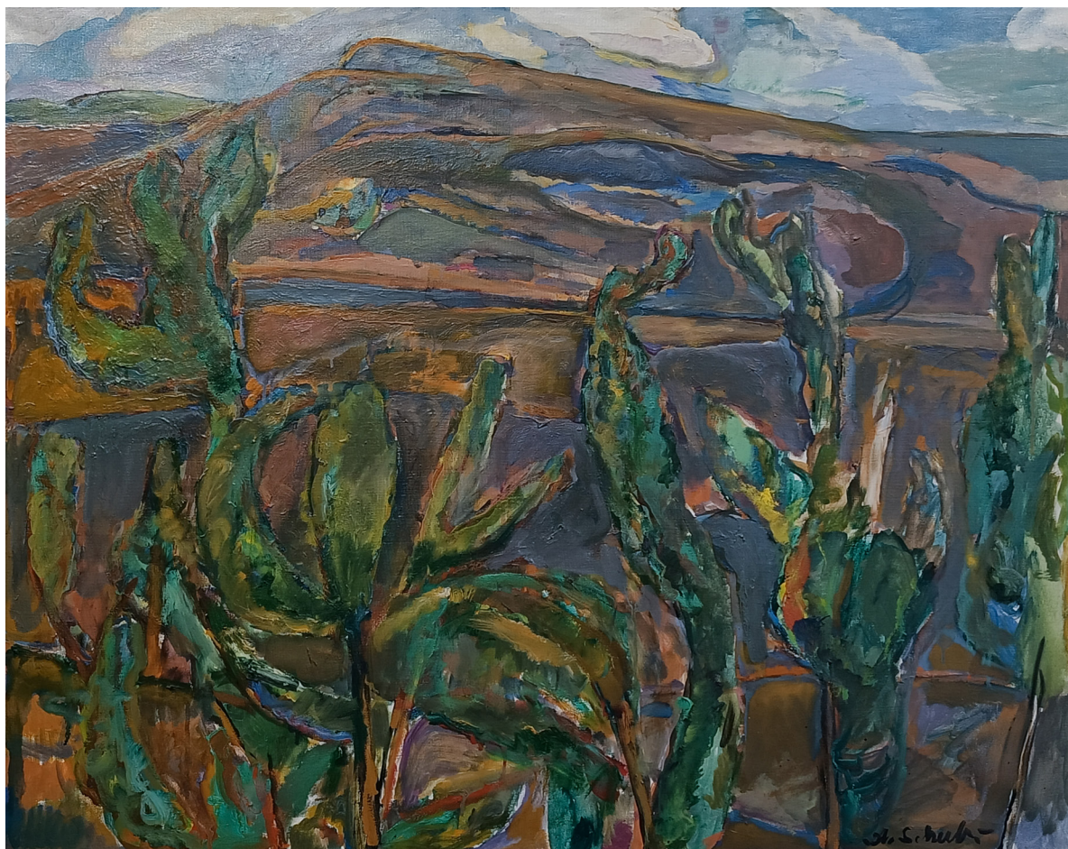
"Landskap fra Toscana" | olje på lerret | 90x78 cm