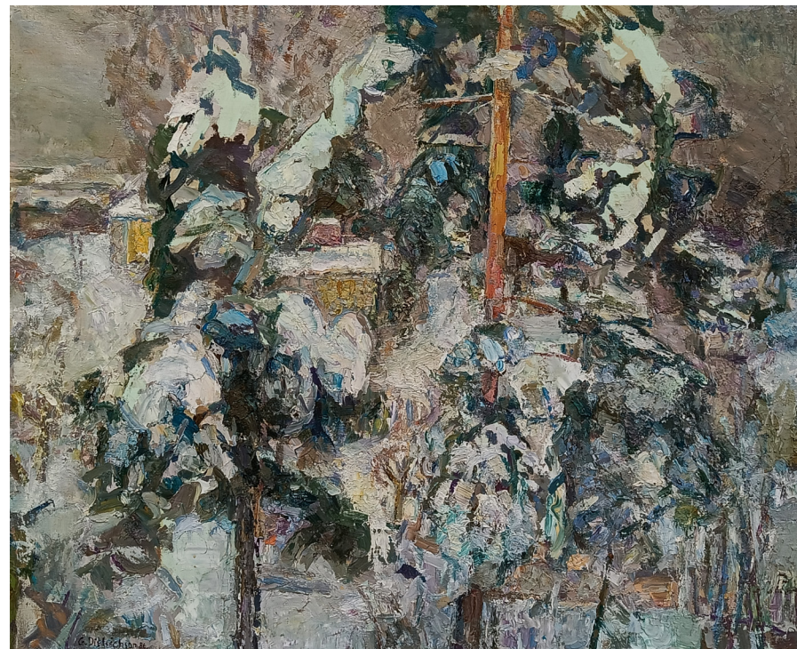
"Vinterskog" | olje på lerret | 95x77 cm