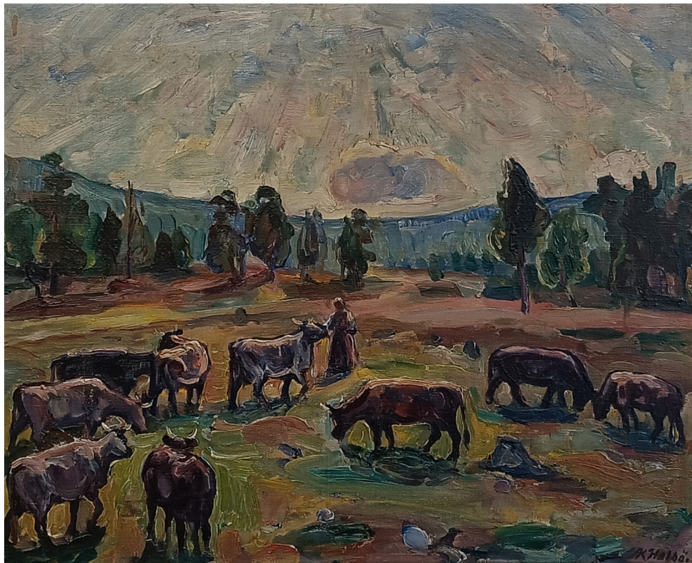
"Kuer på beite" | olje på lerret | 66x55 cm