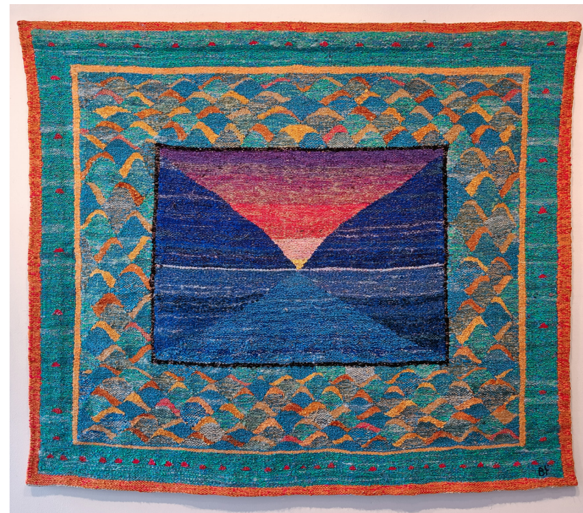
"Landet bakenfor III" | vev | 165x140cm