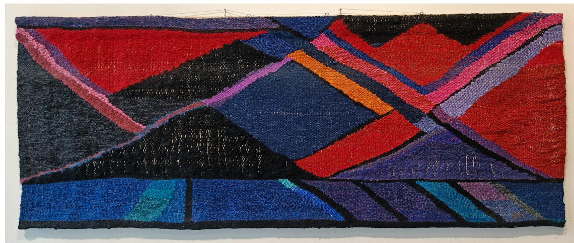
"Blomstring IV" | vev | 152x67 cm