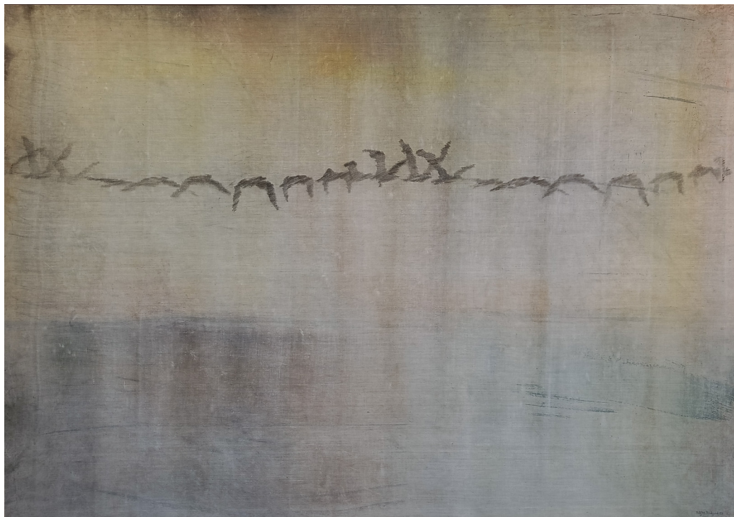
"Fugleflukt" | blandet teknikk på lerret | 185x130 cm

Debuterte med separatutstilling i Unge Kunstneres Samfunn i 1974. Studerte ved Statens håndverks- og kunstindustriskole, og Statens Kunstakademi.. Mottatt flere reise- og arbeidsstipender. Han har et karakteristisk figurativt formspråk, ofte med et stillferdig, lyrisk uttrykk.