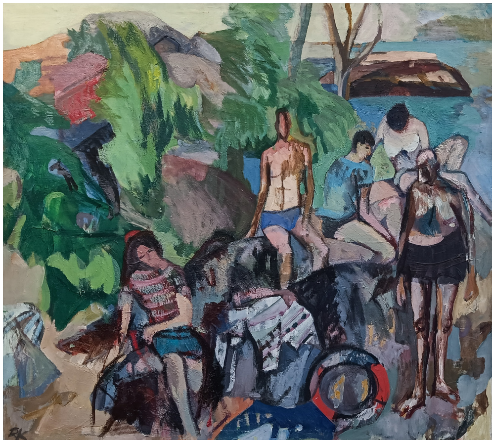
"Badende menn" | olje på lerret | 100x112 cm

Kraugerud var en av den norske mellomgenerasjonens sterkeste ekspresjonister, med roekte og egenartede malerier. Han blir særlig husket som en av skogens malere, men han har også laget strandstudier med badende mennesker med en mye lysere koloritt. Studerte ved Statens håndverks- og kunstindustriskole, og Kunstakademiet, og representert på Høstutstillingen en rekke ganger. Selv karakteriserer han sin kunst slik: Intensjonen er bestemmende. Hovedsaken er å gi konsentrerte og sterke uttrykk for en opplevelse. Kraugerud var en markant skikkelse i nyere norsk maleri.