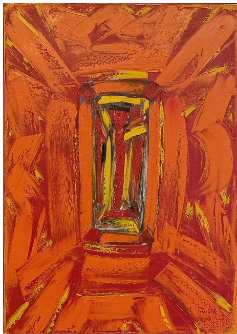
"Ikonsrød" olje på lerret | 72x50 cm