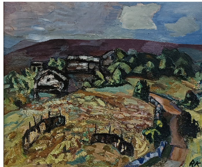
"Høst" | olje på lerret | 72x60 cm