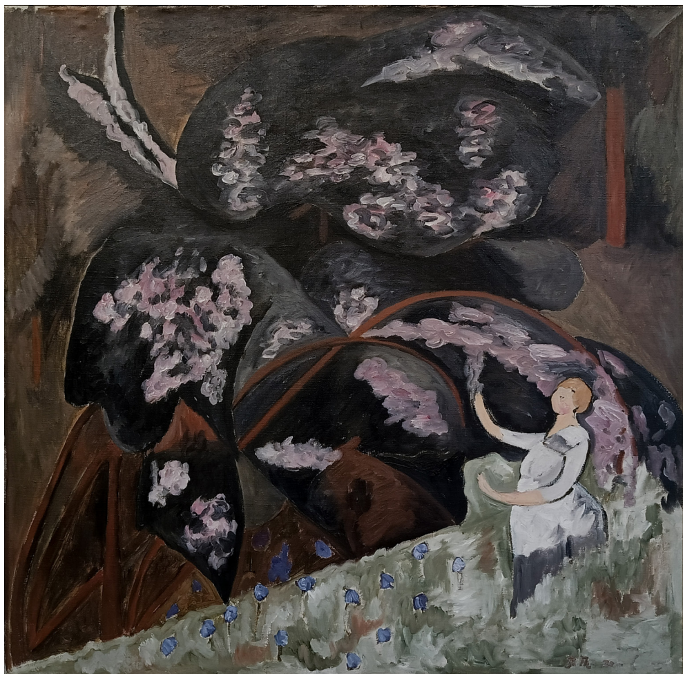
"Rosenquisten" | olje på lerret | 70x70cm