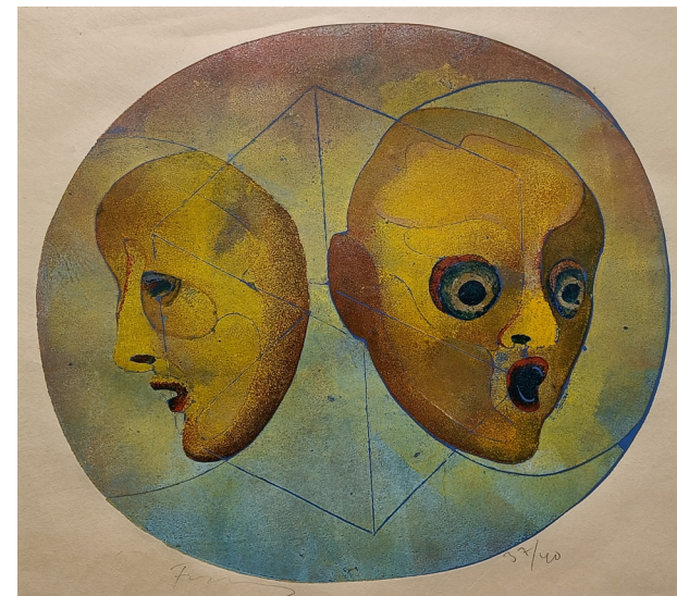
"Uten tittel" | litografi | 52x43 cm

Widerberg regnes som en av Norges fremste malere og grafikere; energisk, ekstatisk, vital og ekspressiv. Han var en gnistrende kolorist med fargersterke bilder i gult, rødt og blått. Han tok for seg sårbare temaer, som livslyst, kjærlighet og følelser. Han studerte ved Statens håndverks- og kunstindustriskole, og Statens Kunstakademi. I 1963 hadde han sin første separatutstilling, og debuterte på Høstutstillingen. Han er representert ved utallige gallerier og kunstsamlinger, og det er utgitt flere bøker om hans kunst. I 1997 ble han utnevnt til Ridder av 1. klasse i St. Olavs Orden.