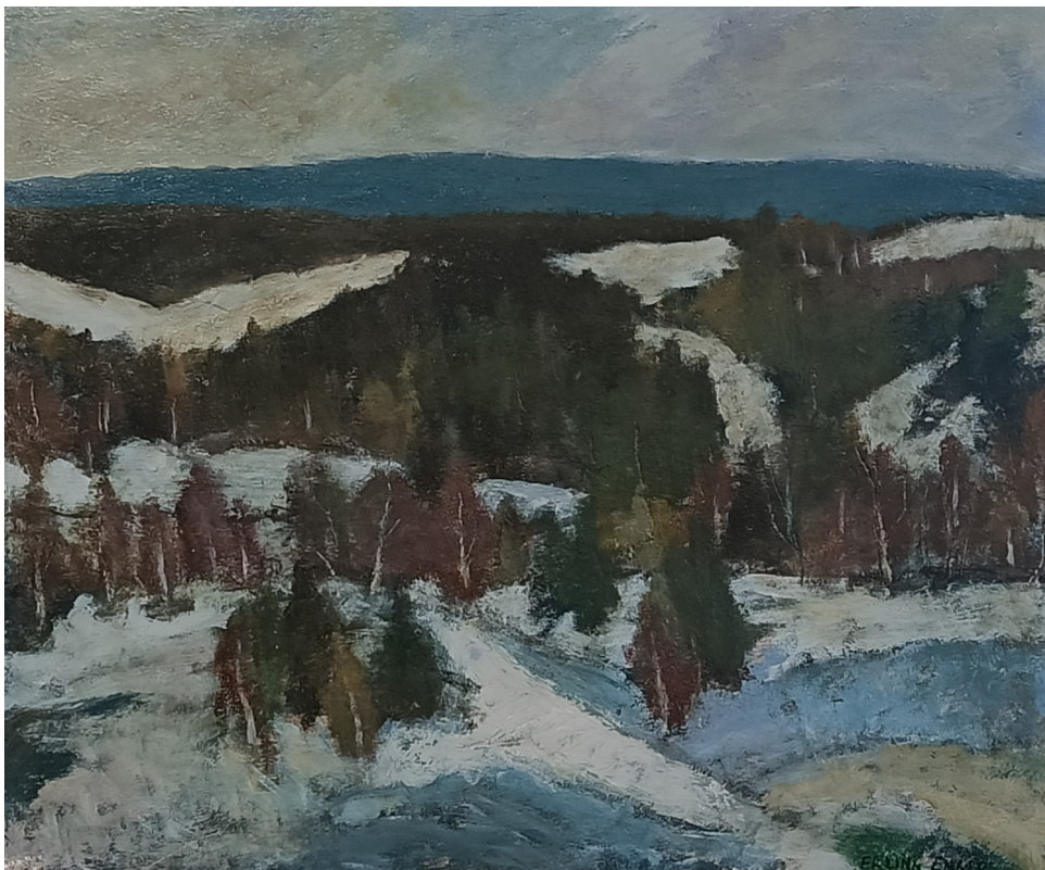
"Skoglandskap" | olje på plate | 55x46 cm