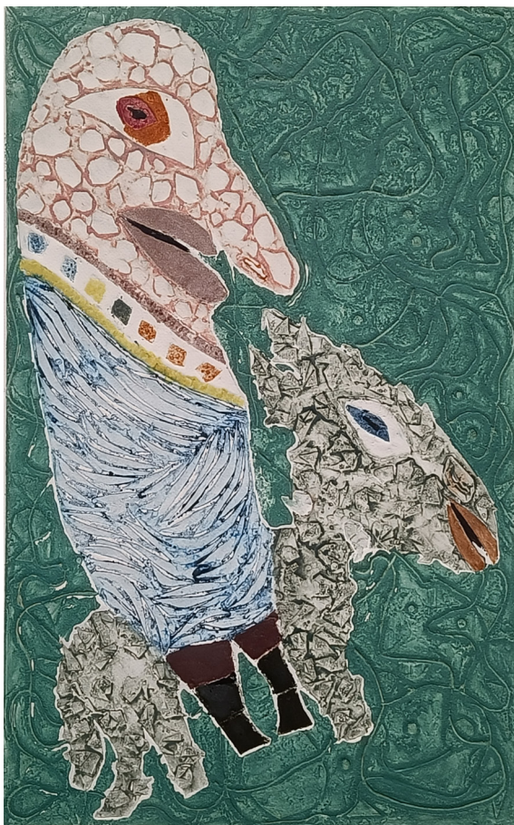
"Uten tittel" dyptrykk 50x39 cm

Nesch var født og oppvokst i Tyskland, men kom til Norge i 1935. Her møter han sin kone skuespilleren Ranghild Hald, og blir norsk statsborger i 1946. Nesch var grafiker og maler, mest kjent for sine metalltrykk. Disse utviklet han med «løse» elementer som gjorde at motivet kunne varieres fra trykk til trykk. Han hadde flere oppdrag for næringslivet, bl.a. «Sildefiske» i Industriens og Eksporens Hus i Oslo, et verk han selv omtalte som et av sine beste grafiske arbeider. Nesch er representert ved flere museer og gallerier i Norge, Tyskland, England og USA, og i 1973 mottok han St. Olavs Orden.