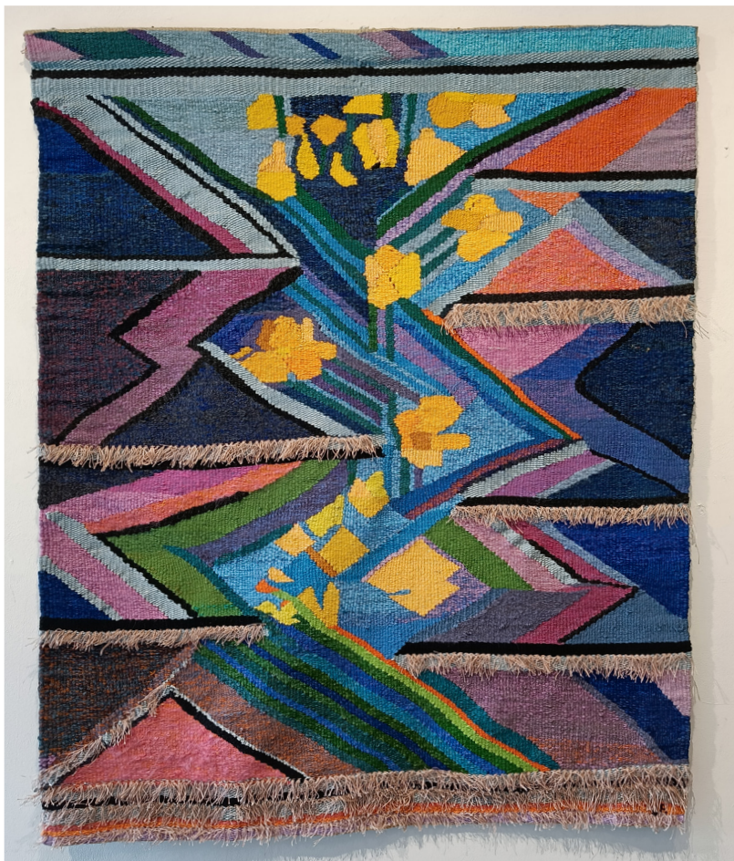
"Blomstring" | vev | 101x146 cm