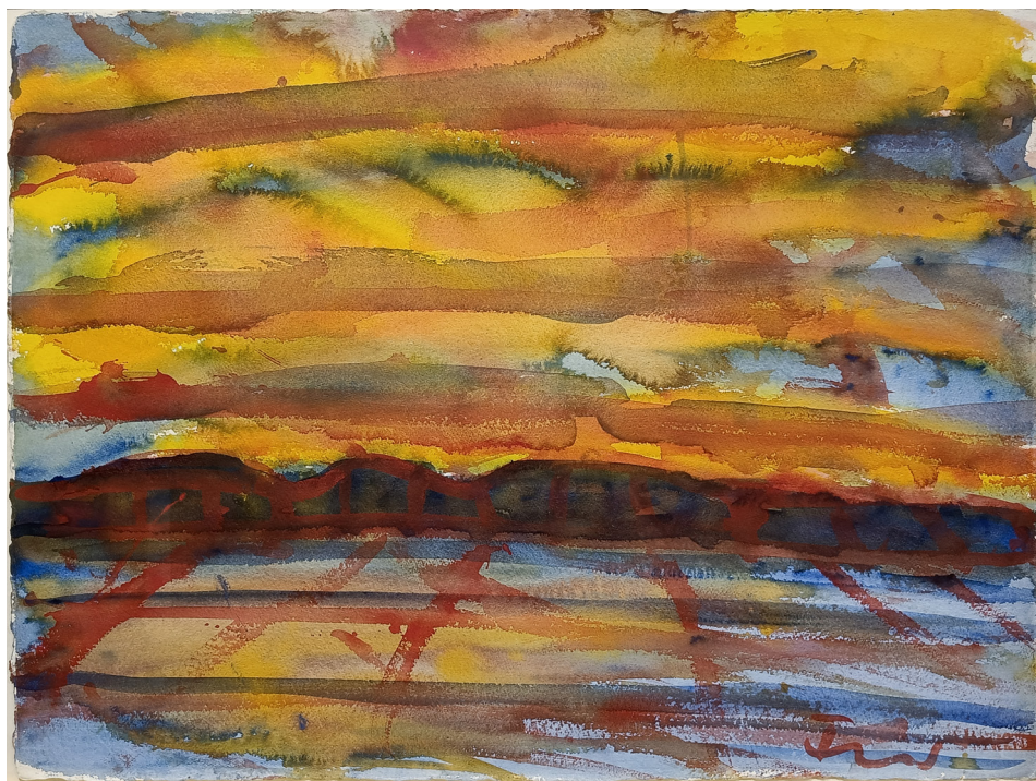
"Landet på andre siden" akvarell | 78x59 cm