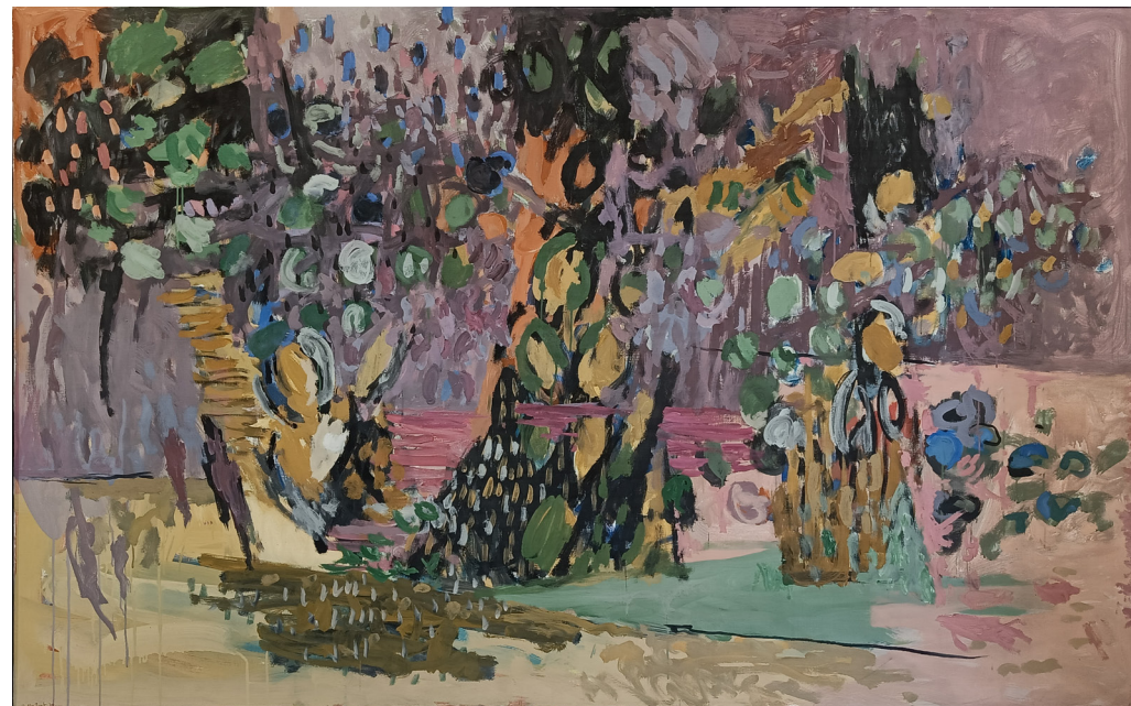
"Fra Hadeland II" | olje på lerret | 196x125 cm