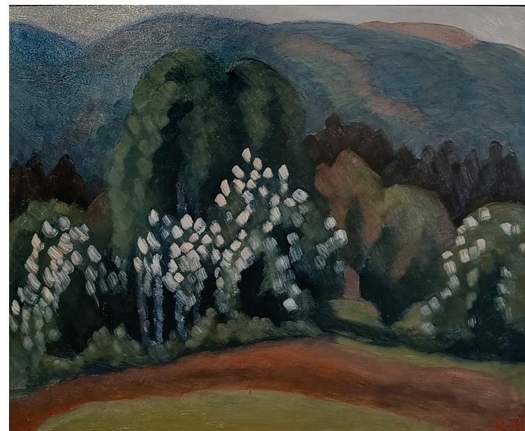
"Uten tittel" | olje på lerret | 73x60 cm