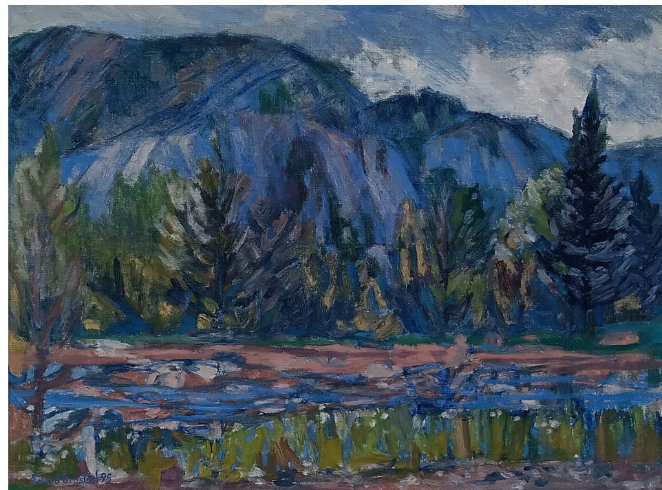
"Fra Flatdal" | olje på lerret | 81x61 cm