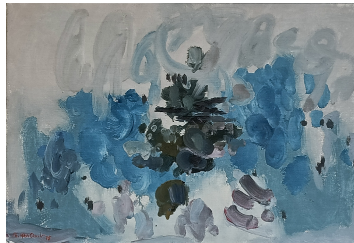
"Blå blomst" | olje på lerret | 55x38 cm

Debuterte på høstutstillingen i 1939, Studerte ved Statens håndverks- og kunstindustriskole, og Statens Kunstakademi under Jean Heiberg. En av våre fremste og fineste kolorister med sine abstrakte naturstemninger ble han en overgangsskikkelse i norsk kunst mellom 30-årenes figurative maleri, og det non-figurative maleriet som brøt igjennom på 50-tallet. Han var fra Oslo, men hadde sitt atelier på Jevnaker. Han hadde utallige utstillinger i både Norge og i Danmark, Sverige, England, Frankrike, USA, m.fl.