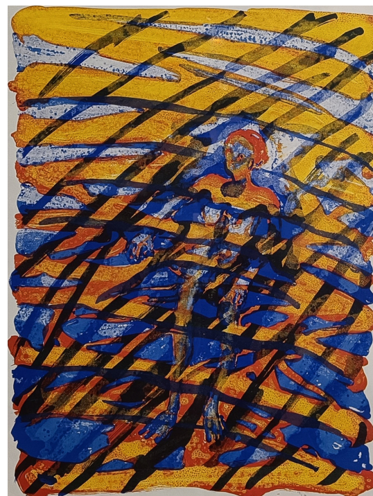
"Uten tittel" litografi | 45x60 cm