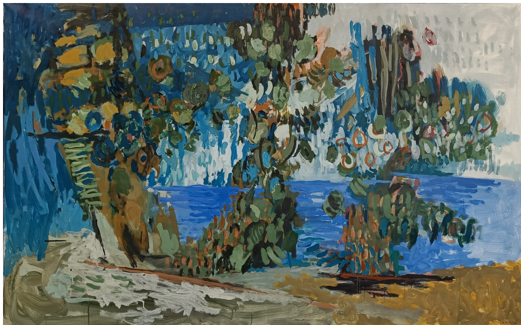
"Fra Hadeland" | olje på lerret | 196x125 cm