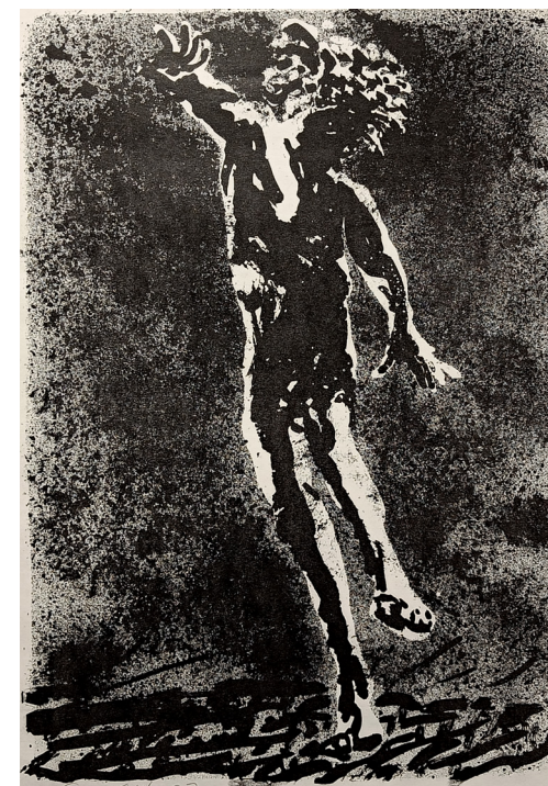
"Løpende mann" litografi | 40x60 cm