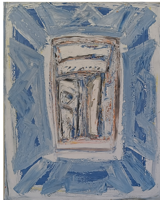
"Ikonsblå" olje på lerret | 66x84 cm