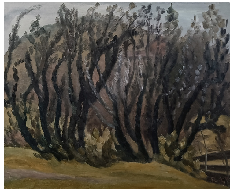
"Lilla busk" | olje på lerret | 73x60 cm