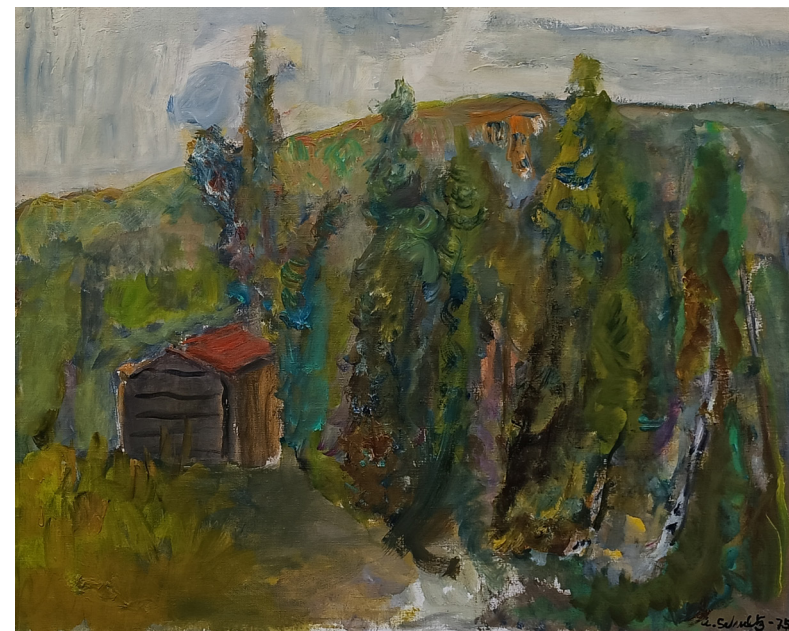
"Til fjells" | olje på lerret | 81x65 cm