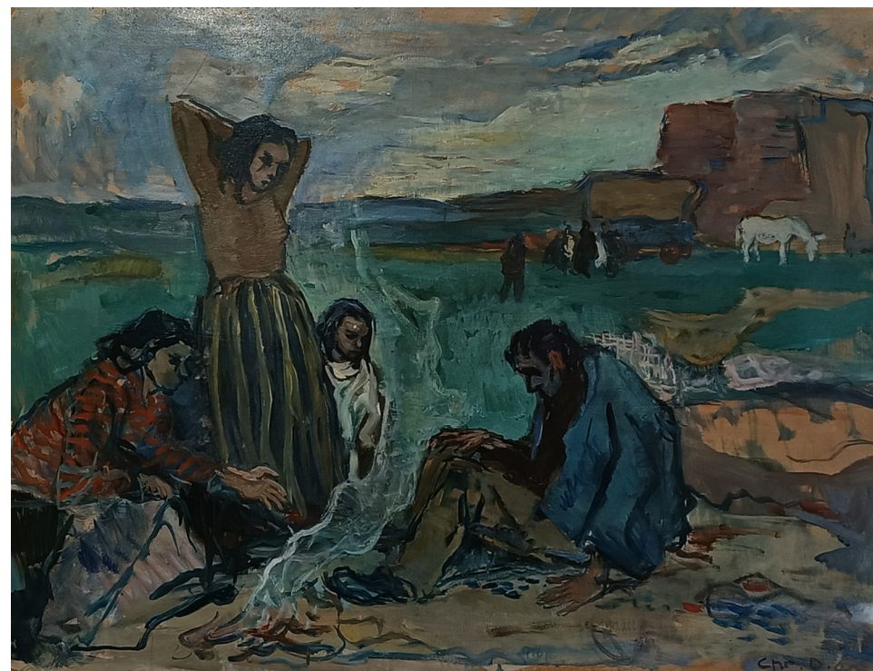
"Sigøynere" | olje på plate | 85x65 cm