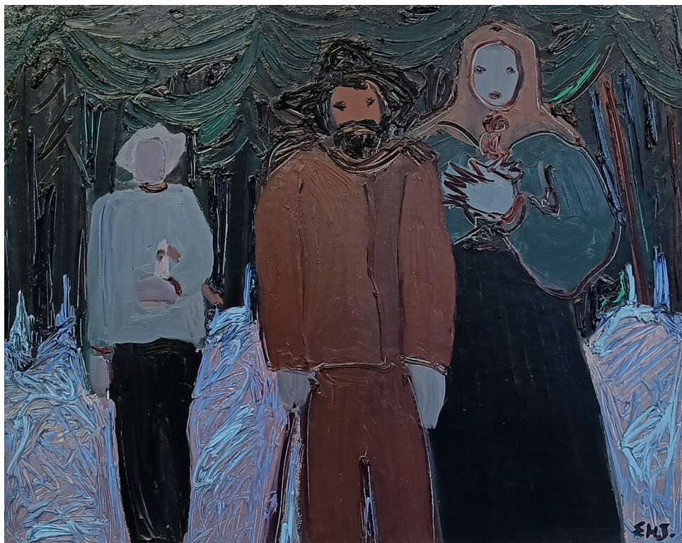
"Skogfolk" | olje på plate | 81x65 cm