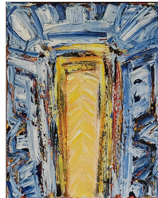
"Døren" olje på lerret | 50x39 cm