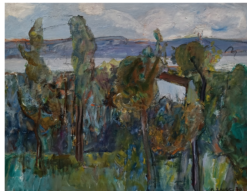
"Ved fjorden" | olje på lerret | 97x75 cm