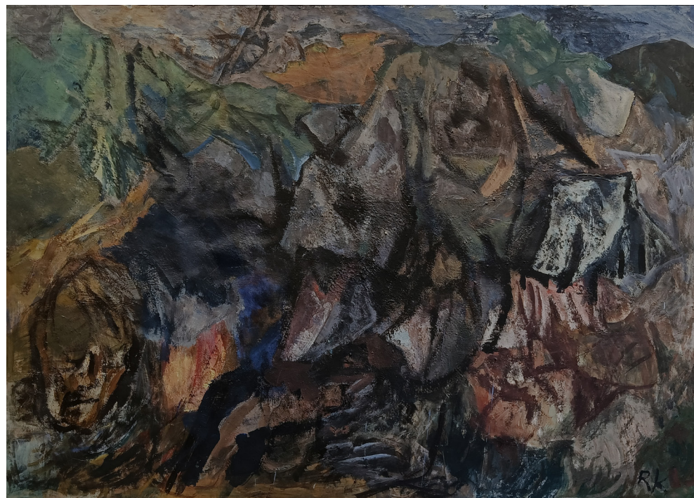
"Uten tittel" | olje på lerret | 184x130 cm