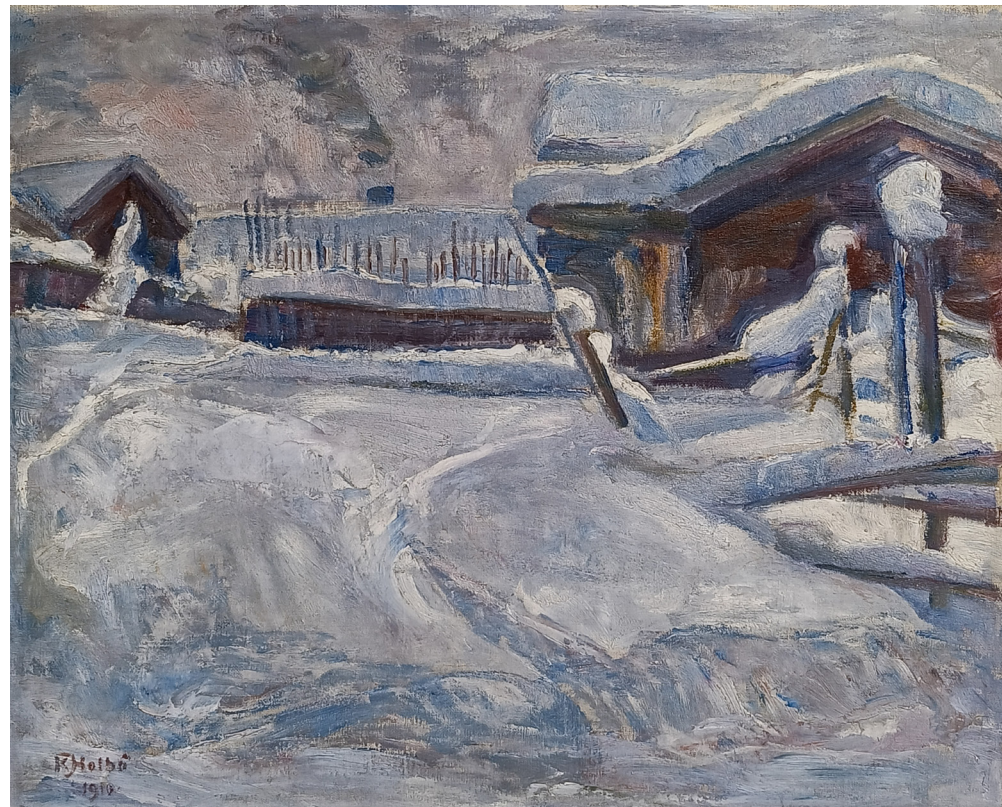
"Vinter" | olje på lerret | 65x53 cm