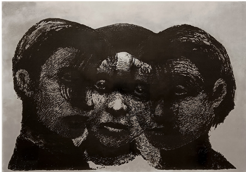
"Øyne" | litografi | 64x47 cm

Espolin Johnson var billedkunstner, illustratør og grafiker. Han var elev ved Bjørn Smith-Halds malerskole i Bodø, og senere Statens håndverks- og kunstindustriskole og Statens Kunstakademi. Hans nære forhold til Lofoten og Nord-Norge preget hans kunst, og mange av hans arbeider er samlet i Galleri Espolin i Kabelvåg som åpnet i 1992. Han har illustrert flere bøker, og hatt flere utsmykkingsoppdrag på hurtigruteskipene. Espolin Johnson har mottatt en rekke priser for sin kunst, og mottok i 1994 Kongens fortjenestemedalje i gull.