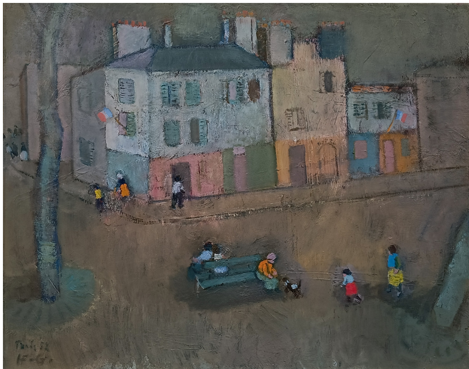
"Levende by" | olje på lerret | 92x73 cm

Han var utdannet ved Statens håndverks- og kunstindustriskole, og Statens Kunstakademi. Han studerte også skulptur og maleri ved Académie Julian i Paris. Han er representert ved flere gallerier i inn- og utland, og deltatt på Høstutstillingen flere ganger.